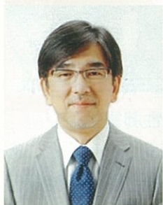
福岡大学西新病院 病院長