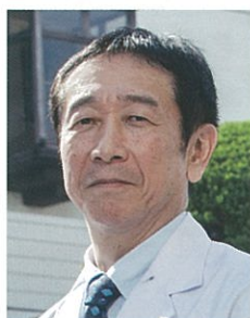
福岡大学西新病院 副院長